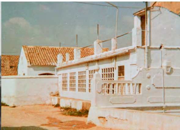
Fotos antiguas de la fuente, abrevadero y lavadero.

propia fuente. Los rituales de cortejo se solían realizar en esta zona, cántaro viene, cántaro va.