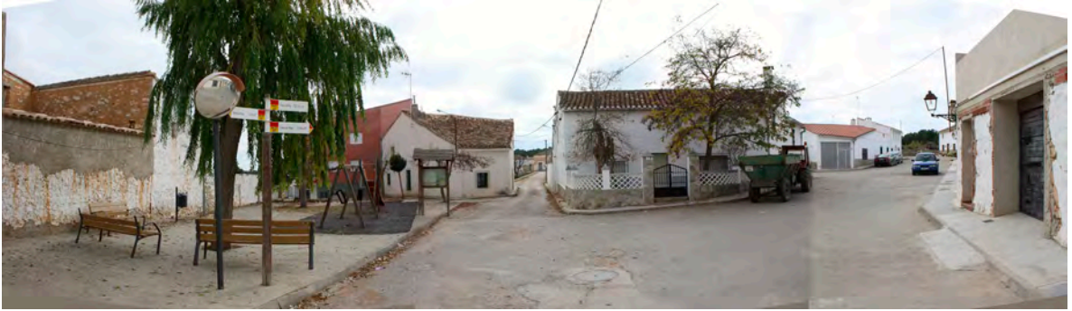
Casas del Rey.

de la Iglesia y las formadas por los ensanches de las calles de San Luis y de la Merced). La construcción de la iglesia se inició en 1927 y fue consagrada a Cristo Rey en 1931.