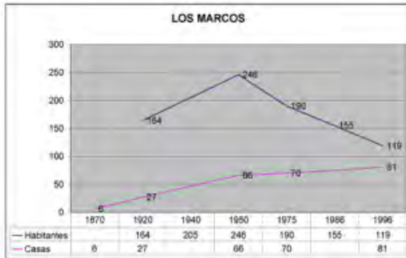
Evolución de la población y del número de casas en el núcleo de Los Marcos. Elaboración propia a partir de los datos aportados por Latorre, 2002.