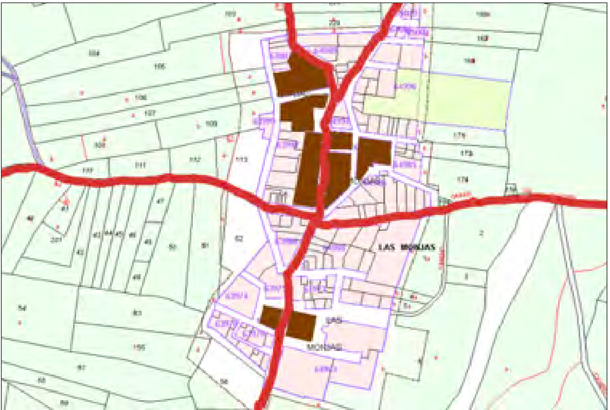
Trasposición del núcleo de Las Monjas en la planimetría de 1904 a la cartografía catastral actual, donde se indican las principales vías de acceso que figuran en la planimetría.