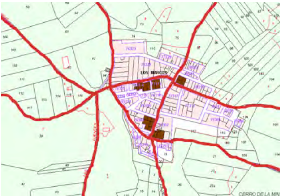
Trasposición del núcleo de Los Marcos en la planimetría de 1904 a la cartografía catastral actual, donde se indican las principales vías de acceso que figuran en la planimetría.

actual todavía resulta visible el trazado de los caminos preexistentes. Y además, «su entramado urbano es similar a la de sus vecinos de Las Monjas y se diferencia del resto de núcleos de población del término de Venta del Moro por su trazado rectilíneo y la casi ausencia de callejones (calle del Mediodía, callejón que