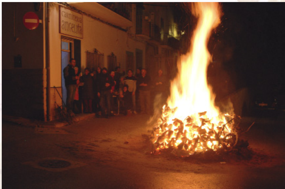
Las hogueras en Venta del Moro pueblo se realizan por calles y grupos de vecinos, familiares y amigos.

San Antonio también es un santo muy vinculado con el fuego . Su supuesta habilidad para reconocer y dominar a los espíritus o demonios, le atribuye un señorío especial sobre el mundo infernal y, en particular, sobre el fuego. Fue considerado