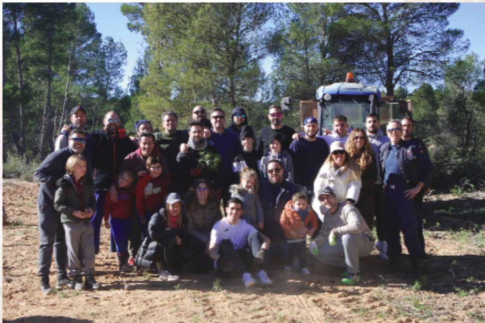
En las hogueras de San Antón es muy importante la participación de los jóvenes. Confeccionadores de la hoguera en Casas de Pradas en 2023.

Quienes confeccionan la hoguera, que son entre veinte-veinticinco personas, con predominio de jóvenes, quedan entre las nueve y diez de la mañana para salir a cortar pinos para la hoguera. La comisión que organiza las fiestas les facilita el almuerzo comunal (generalmente bollos) y la bebida que bien ingieren en la misma aldea o ya en el monte. Se dirigen con unos tres o cuatro tractores al monte, en el área señalada por el forestal o a la parcela de un particular si ha donado los pinos.