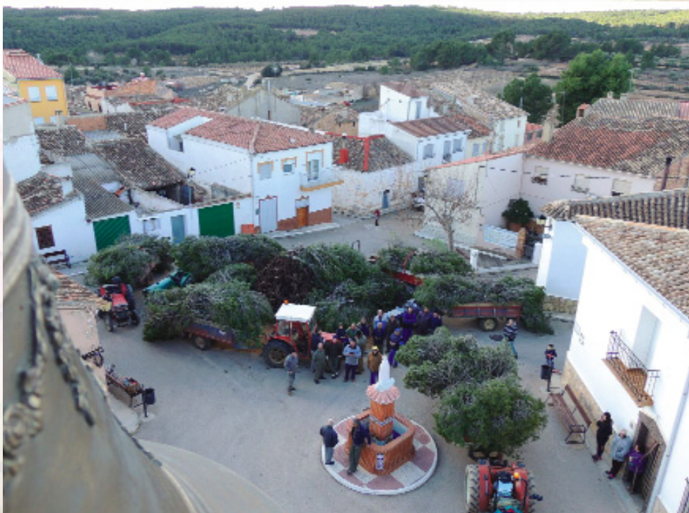
Preparación de la gran hoguera comunal y patronal de San Antón en Casas de Moya (2016, Paco Monteagudo).

Estas hogueras invernales se realizan cuando el campo reposa y las tareas agrícolas menguan en su urgencia. La dureza del frío invernal es contrarrestada con el calor de las llamas en una hoguera comunitaria que reúne a la vecindad para celebrar el santo y/o patronazgo, tras la recolección de las cosechas tradicionales (uva, almendra y oliva).