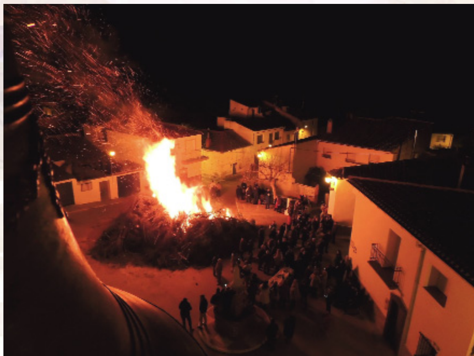
En Casas de Moya se confecciona una hoguera comunal y patronal de grandes dimensiones que congrega a todos los hijos de la aldea (año 2016).

de semana). Independientemente de la meteorología del día (lluvia, nieve), el ritual se lleva a cabo.