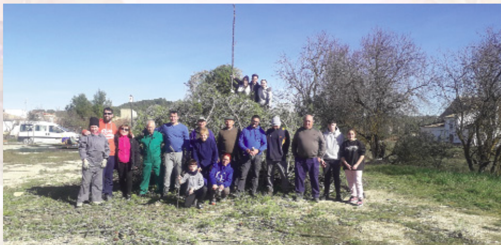
Hoguera de San Antón de Casas del Rey 2023.