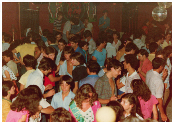
Surgen nuevas formas de baile y recintos. Discoteca Yucatán.

La orquesta tipo preferida en Venta del Moro son las de muy variado repertorio que inician la sesión con música de baladas, rancheras, baile antiguo agarrao (pasodobles, valsos, polkas, copla), incluido el acordeón, y que van subiendo el ritmo con rumba, salsa, pop hasta llegar al puro