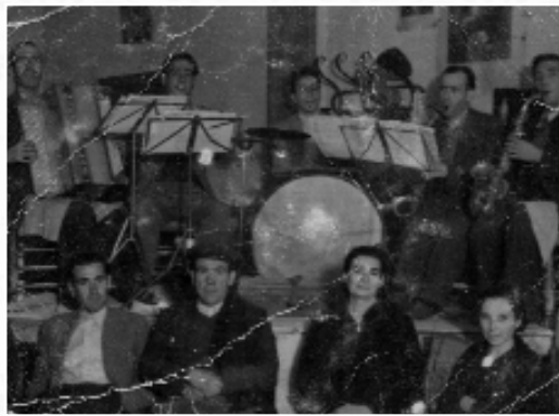
Orquesta venturreña amenizando el baile.