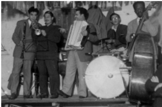
1950s. Baile de orquesta en el Café Collado.