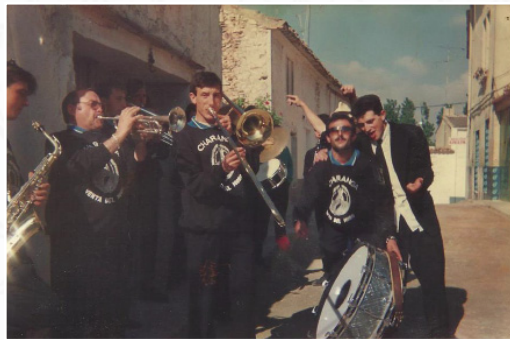
La animada charanga de Venta del Moro que se desplazó a muchos pueblos en fiesta.

vez con artistas conocidos como el revolucionario Rafael Conde "El Titi" (1982), la televisiva Karina (1984), Conchita Bautista (1985) y Los Amaya (1986), cantantes que forman parte del imaginario colectivo de los españoles de la época. Para pasacalles animados qué mejor que la propia charanga de Venta del Moro que actuó en muchas fiestas de otros pueblos en los años ochenta del pasado siglo XX y que estaba formada por músicos de la banda.