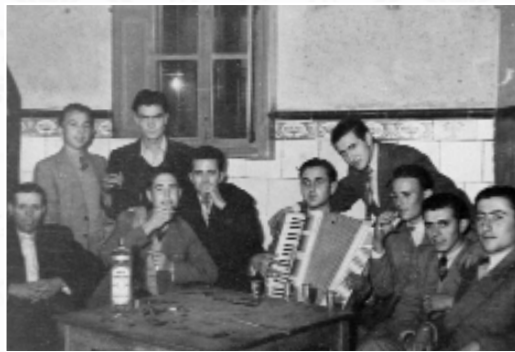
Reunión de venturreños con acordeón por medio.

de Requena (1968) o a los sonidos ya más estridentes de las primerizas discotecas como "El Molino" (Utiel 1970), "Pico Rojo" (Requena), "Sol" (Requena), la "Paty" (Requena 1975), el "Potajero" de Utiel, el "Clipper", etc. En Venta del Moro se abrió paso en 1973 la discoteca "Yucatán" de Lupicinio Beltrán, que congregaba no sólo a gente del municipio, sino de localidades cercanas también. Los bailes de cafés fueron sustituidos por pubs como el "Pipol" y "Yucatán" en 1981 y posteriormente el "Crack 29" y "El Cortijo". Por otra parte, los grupos juveniles llamaban ya a grupos de pop comarcanos como "Los Brujos" de Utiel (que aún siguen actuando) en 1971 en la plaza de toros y en Venta del Moro surgían "Los Ventur".