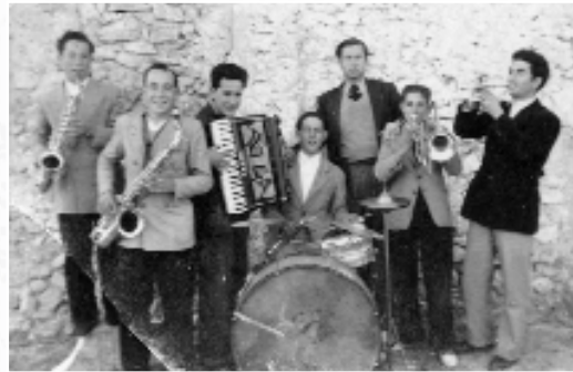
Las aldeas también celebraban sus bailes de acordeón y orquestinas. 1948, orquesta de Jaraguas.

Aparecerán en los programas de fiesta nuevas orquestas que tocaban en el salón de la Cámara Agraria como Piedras Azules (1979), Mapal (1981), Los Soniks (1981), los célebres Diamond (1982) con músicos de la comarca y el propio municipio, Los Centauros (1982), Ita Amarillo and Plátano (1983), Galaxia (1984), Los Cúper (también de la comarca) (1985) o Frontera (1985), entre otras. Esta