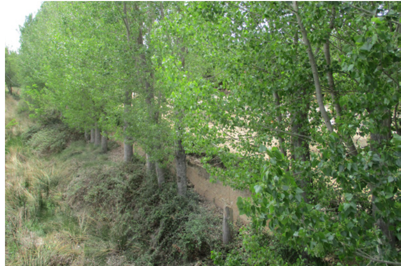
El paisaje circundante en simbiosis con lo urbano. Chopos alineados que delimitan el parque urbano Albosa con la propia rambla

las fabáceas-leguminosas, mientras que el ailanto pertenece a las simarubáceas. Este árbol tiene su origen en Asia, más concretamente en China, desde donde se introdujo en Europa en el siglo XVIII. Su madera se considera de mala calidad y actualmente está incluido en el Catálogo Español de Especies Exóticas Invasoras desde 2013, por lo cual está prohibido su plantación, transporte, comercialización, etc.