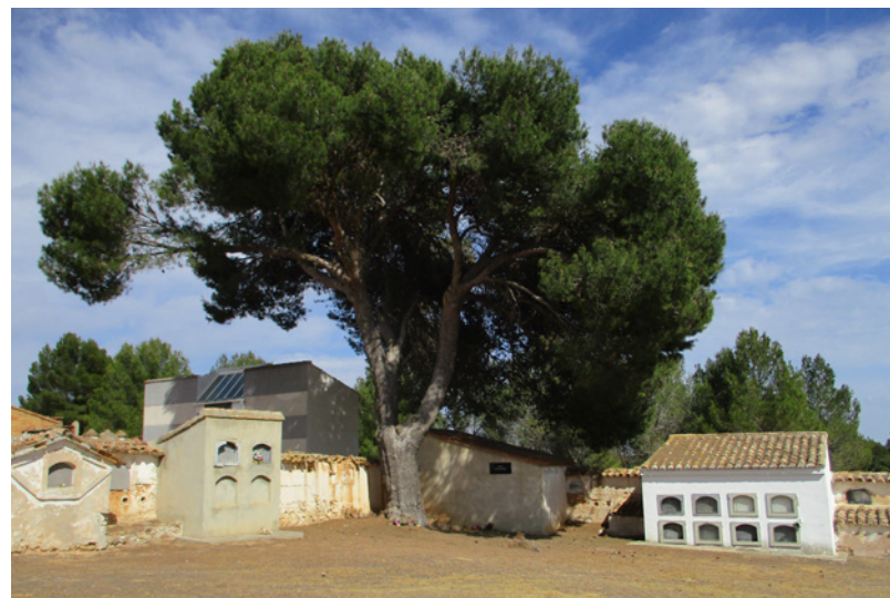
Magnífico ejemplar de pino de Alepo o carrasco en el cementerio. Durante muchos años este árbol ya bicentenario fue el único árbol existente en el interior del camposanto.