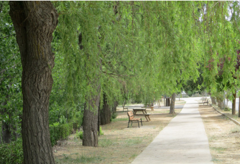
El parque Albosa. Uno de las zonas ajardinadas más amplias de Venta del Moro.