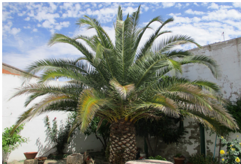
Bonito ejemplar de palmera canaria en un patio interior de la calle Luis Bernat. Esta palmera macho tiene casi cuarenta años de edad

Otro dato también que podemos considerar anecdótico es el caso de la Fuente de los Desmayos , en plena rambla Albosa, donde solo queda un árbol de este tipo. Sería recomendable plantar alguno más, sobre todo por mantener la identidad de esta popular fuente. Aquí también hacemos un inciso ya que en Venta del Moro se denominan desmayos a los sauces llorones (Salix babylonica) , no es que la denominación sea exclusiva de esta población, pero ocurre que también se denominan popularmente así a otros árboles o variedades arbóreas en clara alusión a su porte caedizo o colgante. El ejemplo más próximo lo tenemos en una variedad de almendro muy extendido por toda la comarca: la largueta o desmayo largueta . Y, hablando de almendros,