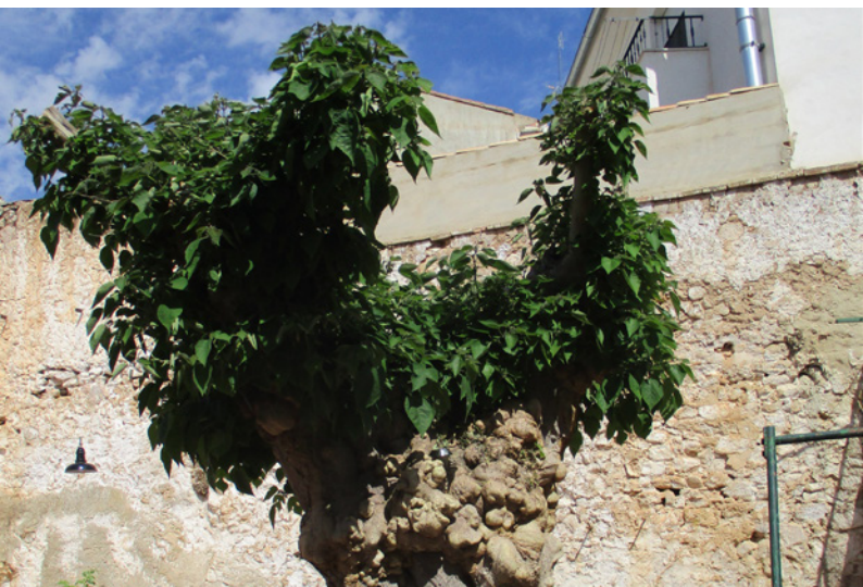
El único ejemplar de morera de papel de Venta del Moro, en un patio interior de la calle Monterá. Como ya tiene sus años presenta en su tronco esas rugosidades características de estos árboles.

En la catalogación que hemos realizado hemos contabilizado un total de 756 árboles en el casco urbano de Venta del Moro repartidos entre un total de