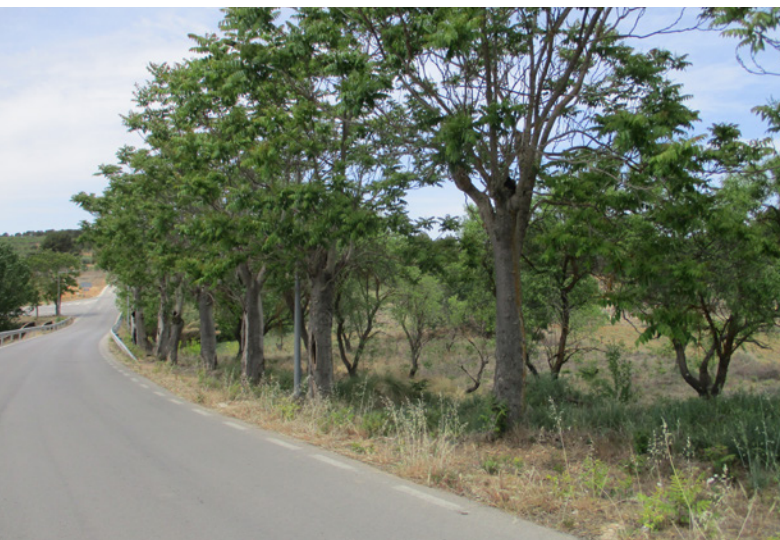
Alineación de “acacias” o árboles del cielo en la entrada del pueblo por la carretera de Tamayo. Plantadas a principios del siglo XX.

el espacio formando una llamativa cubierta vegetal y generando un ambiente agradable y fresco durante los días del estío. Aparte de los ejemplares de washingtonias, antes citados, que dan ese toque de exotismo al pueblo, incluso desde fuera del casco urbano como las que podemos encontrar en la plaza de José María Castillo, ya que tienen un tamaño considerable, hay otros ejemplares de palmáceas muy interesantes como las palmeras canarias ( Phoenix canariensis ) una en la calle Emilio Díaz Guindo y otra en la calle D. Luis Bernat nº 9 de tamaños ya importantes. La de la calle Luis Bernat tiene unos 38 años de edad, es un ejemplar macho con un buen tamaño y buen estado.