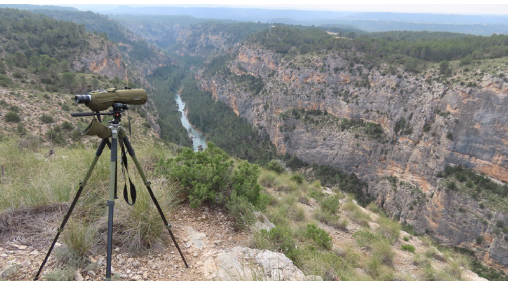
Censando aves rupícolas en las Hoces del Cabriel.

otros en los que hoy no queda ya ni rastro de ellas.