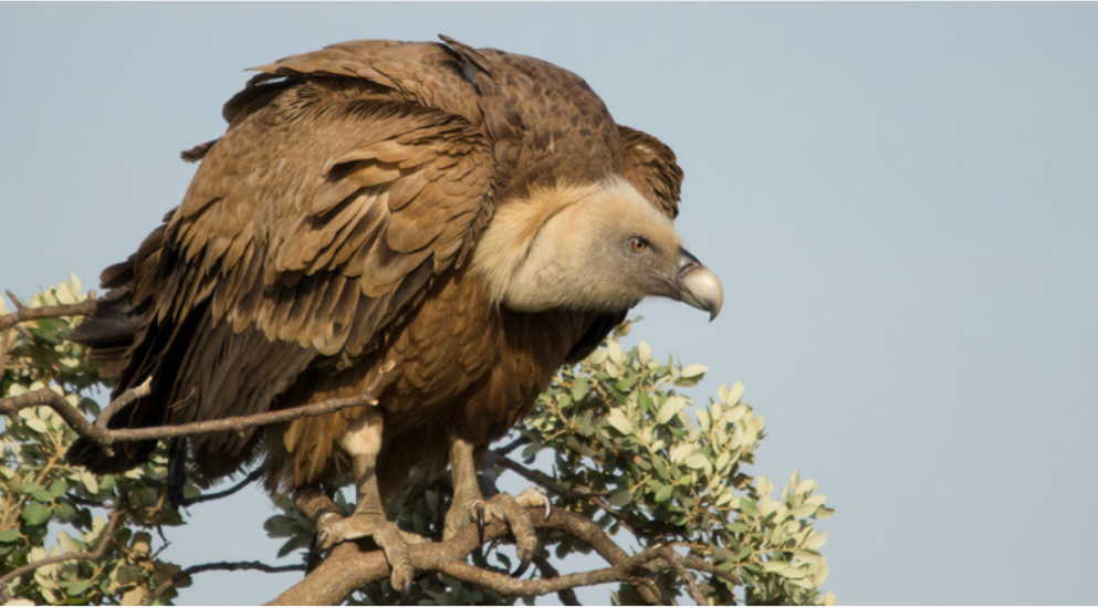
Buitre leonado.