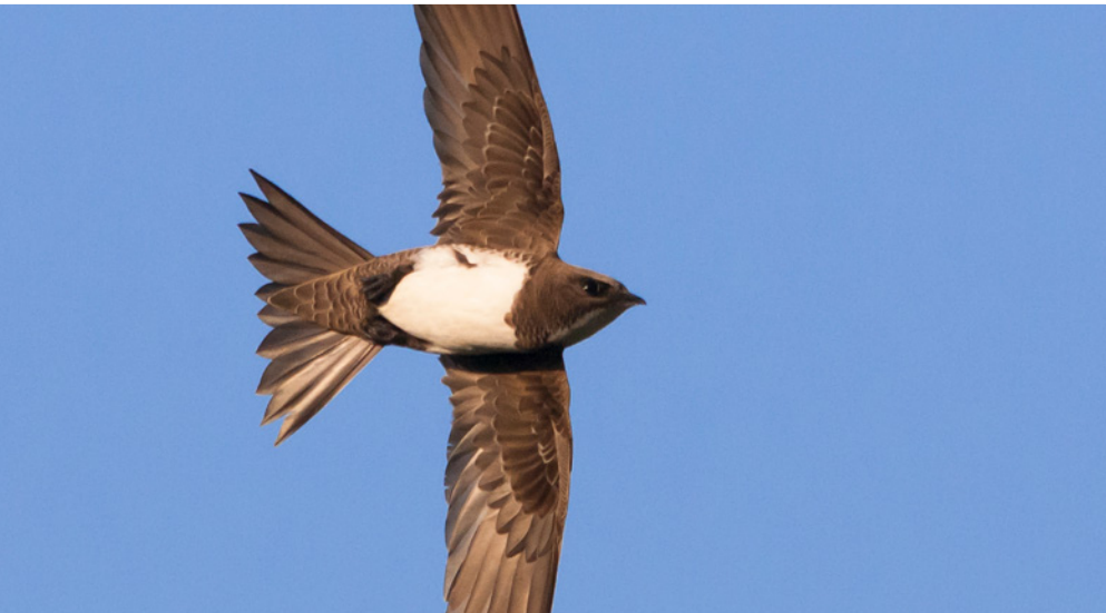
Un misil viviente, el halcón peregrino.