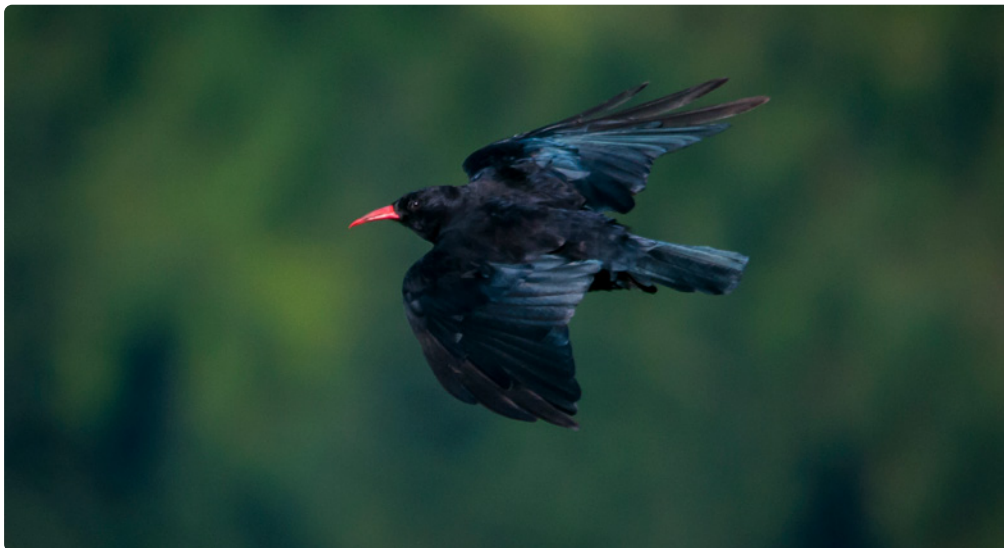
Chova piquirroja en vuelo.

Eso en lo que hace referencia a las aves que tienen querencia por la roca; pero