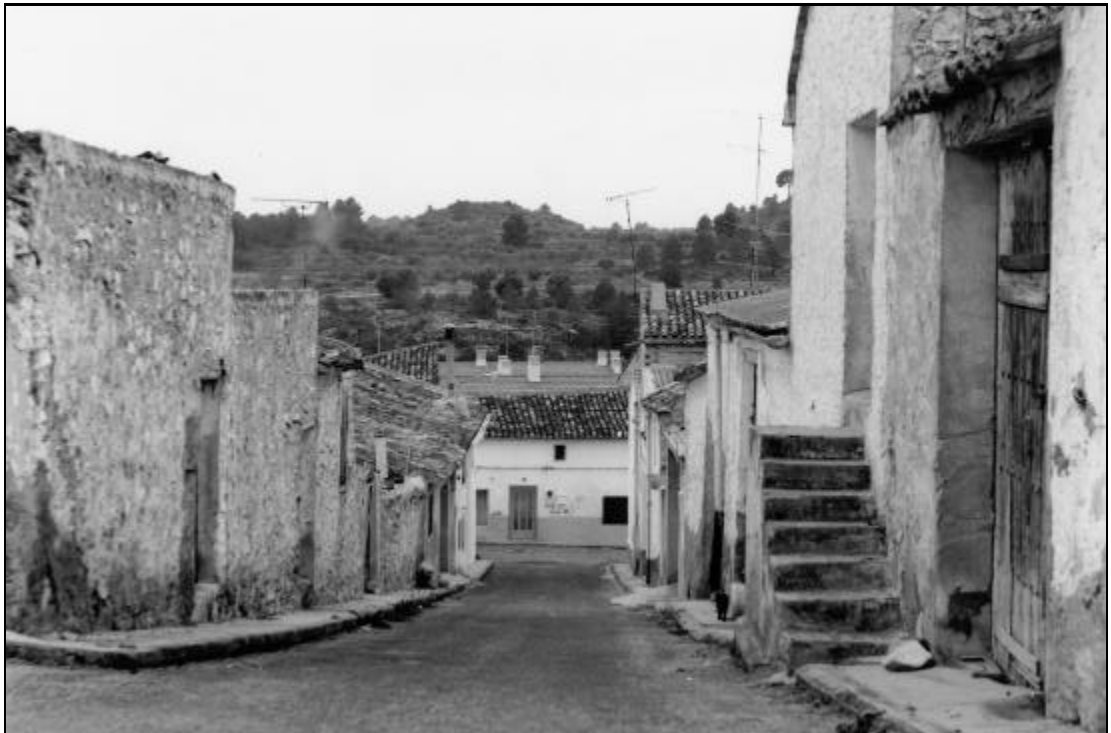
Calle del Padre Damián