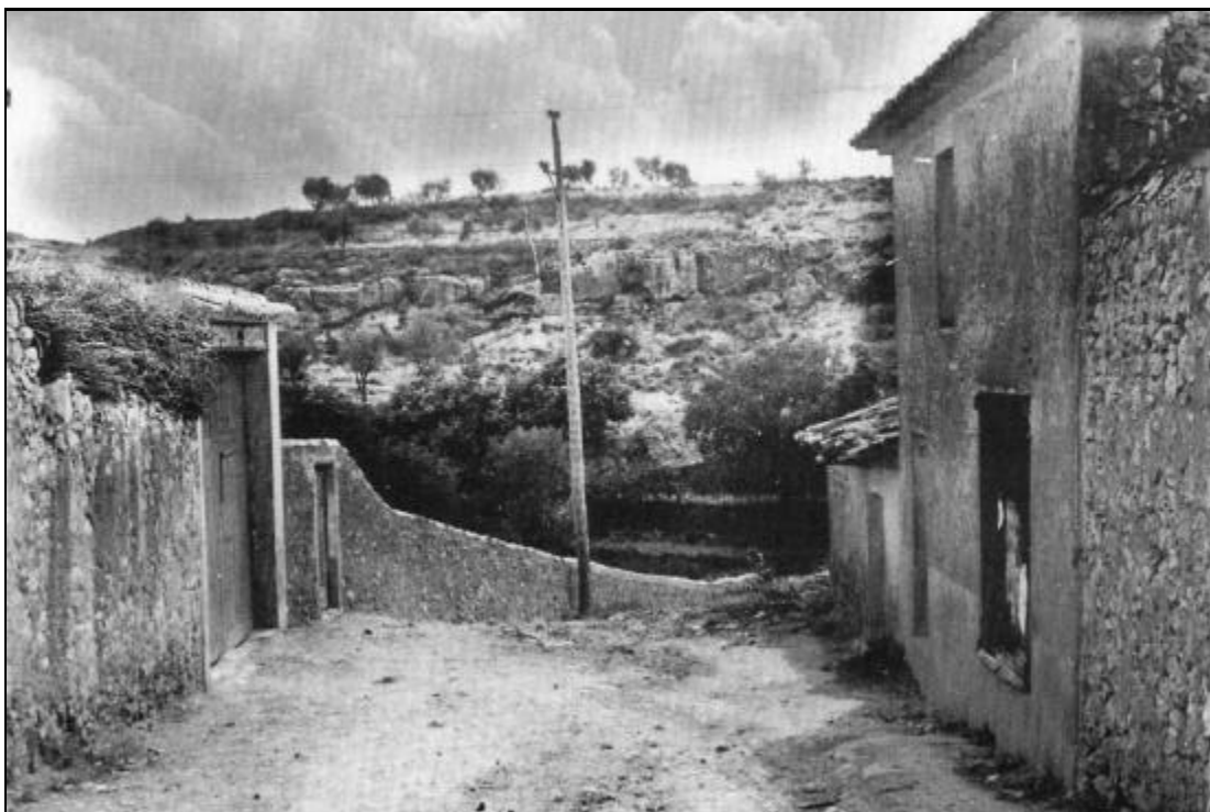
Foto antigua de la calle Sindicato, donde se ubican los callejones de la Sorda, de los Chicharras y de Tío Cuelgues.

¡Pudo ser así o no? ¡Ojalá y alguien hallara restos -de cualquier clase- que aclararan algo sobre el tema para hacerme caer de mi opinión!