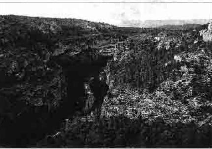
ALLEGACIONES. La zona del Rabo de la Sarría es uno de los meandros que dibuja el río Cabriel en Venta del Moro.

Las alegaciones de la Asociación Amigos de Venta del Moro achacan a la «gran tardanza» de la consellería las actuaciones negativas y perjudiciales para el ecosistema