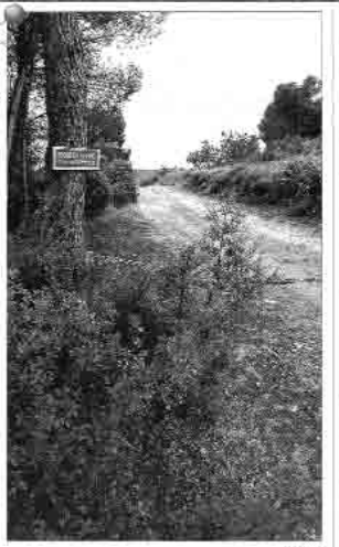
SIN ADEORO. Una de las acciones realizadas en el terreno de San Juan.