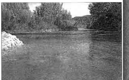
PROFESIA. La mala situación del río Cabriel no concuerda con la declaración de Parque Natural.

A Sierra, Requena. La Asociación del Desarrollo Sostenible de las Hoces y el Cabriel y la Asociación Cultural de Amigos de Venta del Moro (AVM) han hecho llegar al conseller de Medio Ambiente una carta abierta en la que se denuncian las agresiones al entorno medioambiental de las Hoces del Cabriel y las supuestas irregularidades en la concesión de ayudas y subvenciones para la ejecución de proyectos de vertidos cloacales en esta zona.