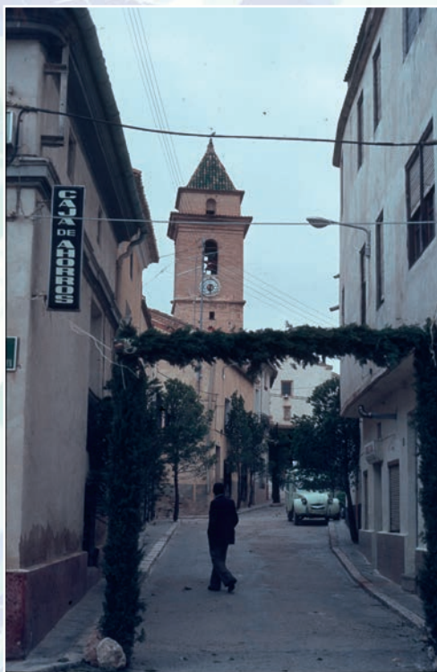
Enramadas y pinos en la Semana Santa de Venta del Moro (Archivo Fotográfico Fermín Pardo. Archivo Municipal de Requena).

El ciclo festivo y tradicional del término municipal de Venta del Moro no puede obviar la presencia del elemento vegetal en casi todas sus manifestaciones. La coexistencia de los vecinos con una extensa masa forestal y agrícola propicia que lo vegetal esté dentro de la cotidianidad tanto laboral como festiva. Desde los árboles más socorridos del término (pinos, carrascas, sabinas, chopos, quejigos, olivos, almendros, almeces, nogueras...) hasta la gran diversidad del monte bajo (enebro, brezo, coscoja, romero, tomillo, espliego, morquera, boj, mataparda, esparto, rabogato, carrizo, salvia, hierba de san Juan, té de monte, hinojo, aliaga, jara, etc.) junto con las vides y los cereales proporcionan una buena materia prima para los ritos venturreños con funciones protectoras, festivas y hasta mágicas. Analicemos algunas de estas prácticas.