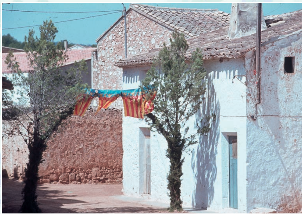
Enramada de Casas del Rey en fiestas de verano. (Archivo Fotográfico Fermín Pardo. Archivo Municipal de Requena).