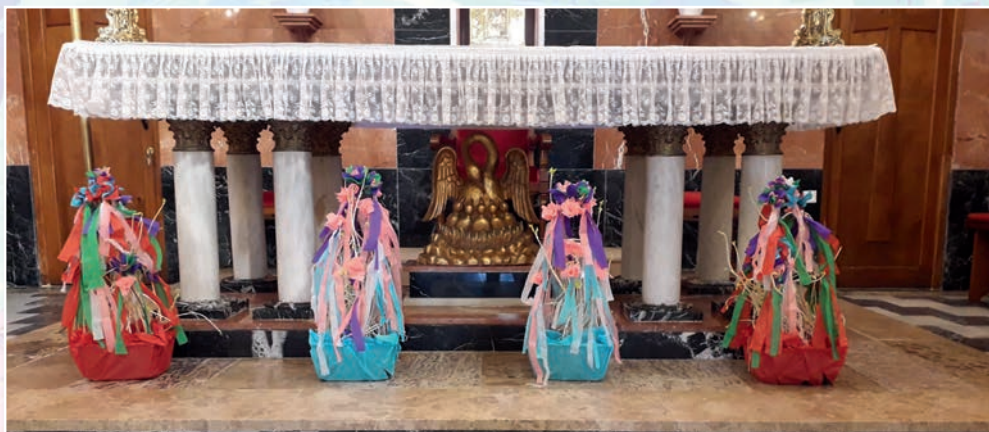
Vergeles dorados a los pies del altar en las fiestas de la Virgen de Loreto de diciembre de 2020 en Venta del Moro.