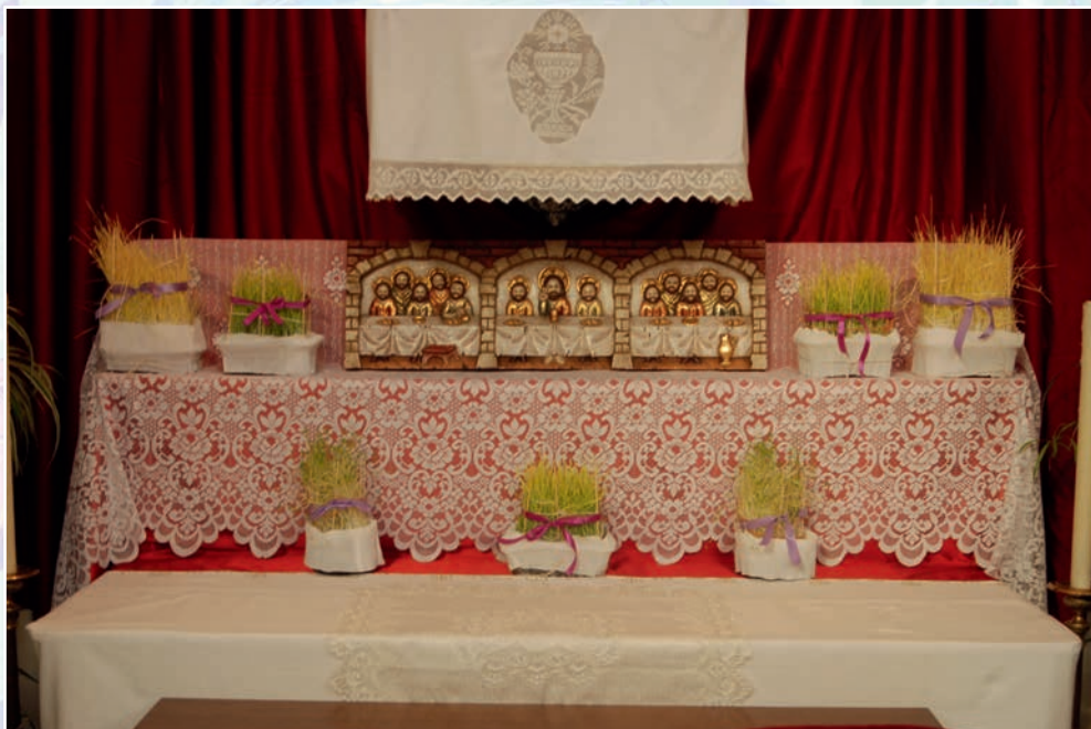
Monumento de Semana Santa con vergeles de tipo verdes o triguillos en Venta del Moro año 2018 (foto autor).