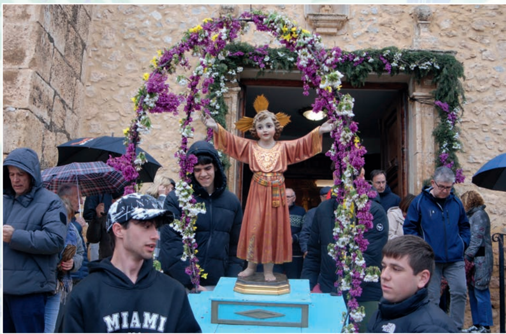
Adorno del niño Jesús por los quintos en la Procesión del Encuentro de Venta del Moro año 2025.

En Jaraguas , para el Domingo de Pascua, aunque no se realizaba la ceremonia religiosa del Encuentro, sí se hacían enramadas con pinos, ramaje verde y flores de papel y se colocaba un Judas o pelindango; monigote confeccionado con ropas viejas que al final de la fiesta se manteaba. Las enramadas no se desmontaban acabada la Pascua, sino que permanecían para ser aprovechadas, con los consiguientes arreglos, en la fiesta de los mayos y, sobre todo, para la fiesta de la Patrona la Virgen de los Desamparados el 8 de mayo.