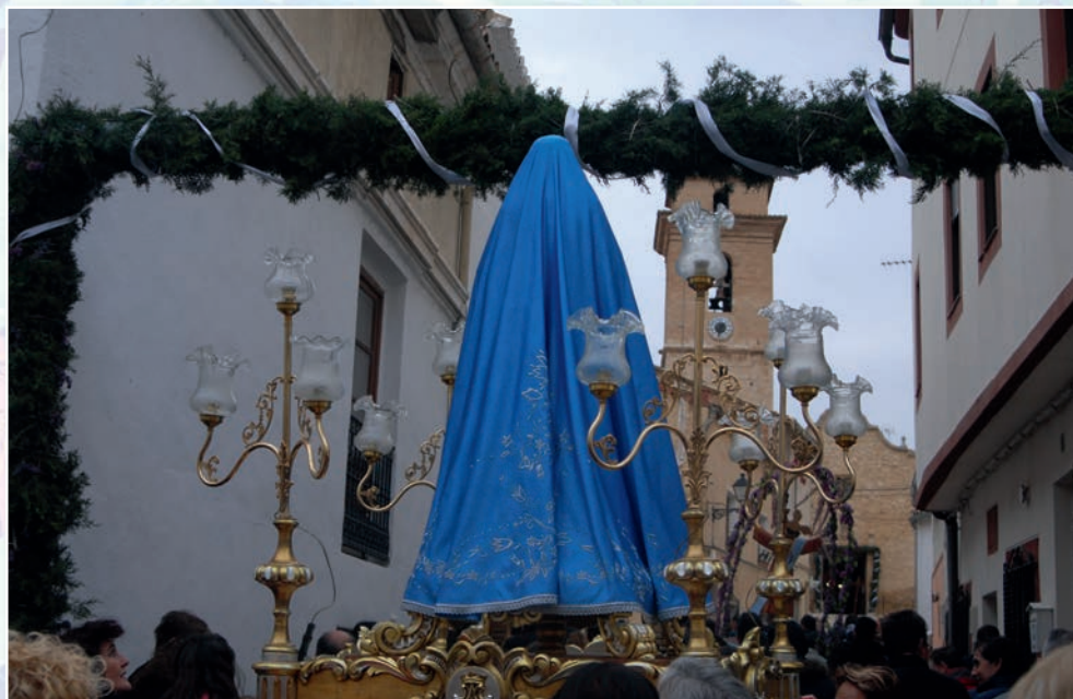
La Virgen pasando por la enramada en la Procesión del Encuentro de Venta del Moro en 2025.

pique general de campanas. Durante toda la noche, el campanario de la iglesia parroquial de Venta del Moro queda abierto para que cualquier vecino y allegado pueda participar en este rito sonoro. Del mismo modo, los quintos y quintas dedican esa noche a adornar las tallas del Niño y de la Virgen que saldrán a la mañana siguiente en la procesión del Encuentro.