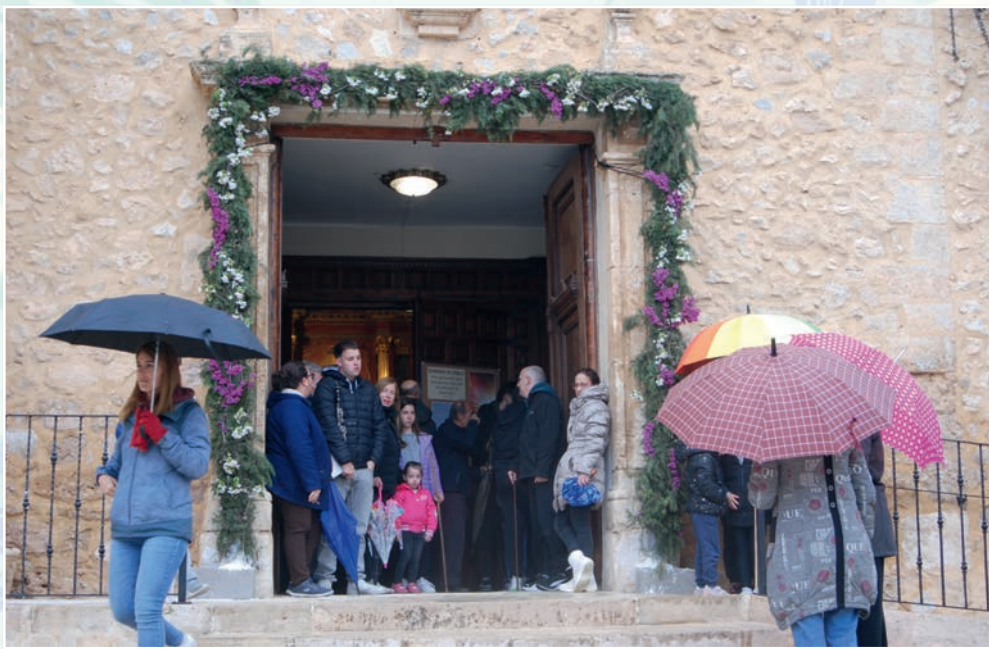
Enramada de Semana Santa en Venta del Moro año 2025 (foto autor).

Los vergeles consistían en los germinados de distintas clases de semillas. Básicamente eran cereales, sobre todo trigo, centeno, cebada y araza (maíz). También se utilizaban semillas de otras plantas como lentejas, judías, garbanzos, guijas o habas. Estas semillas siempre se sembraban en recipientes bajos como cazuelas, platos, latas metálicas y otros. Se usaba como sustrato y soporte para la germinación tanto tierra buena como estopa o algodón en rama. Siempre eran elaborados y ofrecidos por las mujeres, constante que observamos en todos los lugares donde se