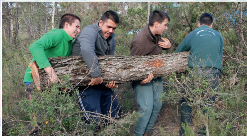
Corte de pinos para la Hoguera de la Virgen de Loreto en Venta del Moro en diciembre de 2016.

de San Antón en el pueblo y aldeas, con especial referencia a Casas de Moya; así como las de san Julián el cestero y otras ya desaparecidas. Sólo comentar lo unida que está esta tradición con nuestro entorno forestal y agrario. Quemar lo vegetal como símbolo de purificación, renovación y luz. Para las hogueras grandes, el material vegetal utilizado es el pino en un ritual que comporta el corte y montaje colectivo de la hoguera con pitanza comunal y fiesta. Se aprovecha la viga, tronco o caña junto con el ramaje, que es cargado de forma armoniosa en tractores. Para hogueras menores, como pueden ser las que se hacen en los barrios de Venta del Moro por san Antón o las de san Julián el Cestero, se utilizan especialmente las cepas viejas arrancadas. Material combustible, el de los pinos y cepas, muy fáciles de encontrar cerca de cada núcleo poblacional.