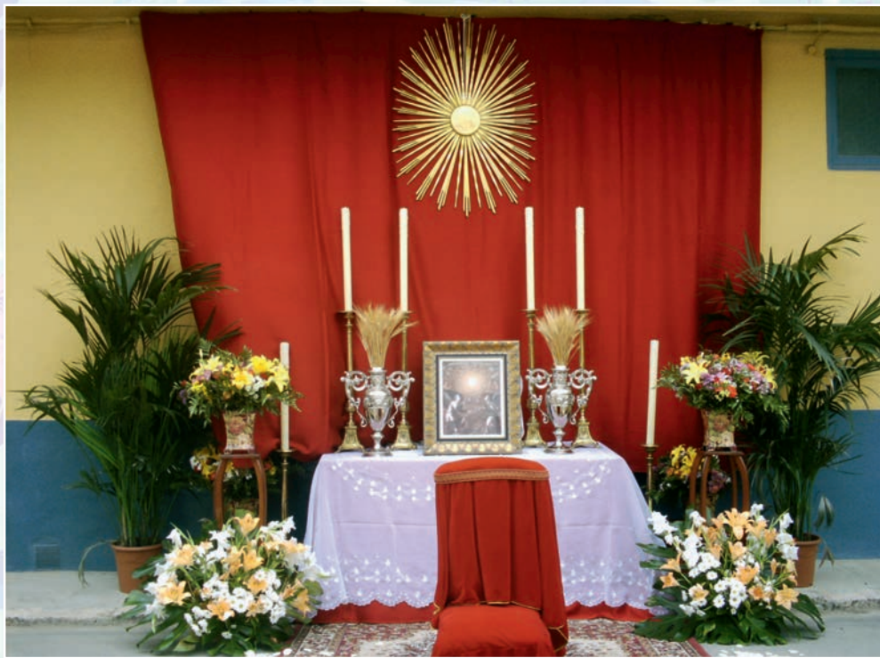
Altar del Corpus en Venta del Moro en mayo de 2008 (foto autor).

Esta copla nos recuerda uno de los periodos mágicos del año: la noche de san Juan. Una noche y alba con mucho simbolismo que marcan el solsticio de verano o el inicio de un nuevo ciclo en el año. En Venta del Moro, con las primeras luces de la mañana, las mozas iban a las fuentes cercanas a lavarse la cara y a ver la luz primeriza a través de un cedazo. Se decoraban la frente con guirnaldas de hojas de nogal y de desmayo, además de portar florecillas silvestres en la mano. Las ramas de nogueras cortadas antes de la noche de san Juan tenían un simbolismo protector. Los mozos venturreños esperaban a las jóvenes con racimos de cerezas rojas y recién recolectadas de los numerosos cerezos que envolvían la población y por la cual nos apodaban a los venturreños como «cerreceros».