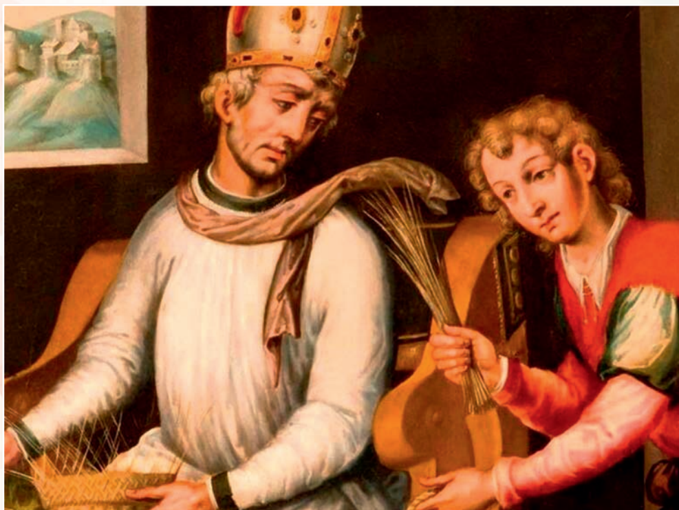
Imagen de San Julián confeccionando cestas de mimbre con su criado Lesmes. Anónimo del siglo XVIII. Catedral de Cuenca.

Pero, además, la tradición y hagiografía le atribuye a San Julián un destacado carácter caritativo y de obispo preocupado menos por los asuntos de la corte que por su feligresía, especialmente por los pobres. De ahí que se le denomine como «santo limosnero» o «padre de los pobres» y su culto se impulsara en Cuenca y su diócesis a partir de 1471 con este carácter.