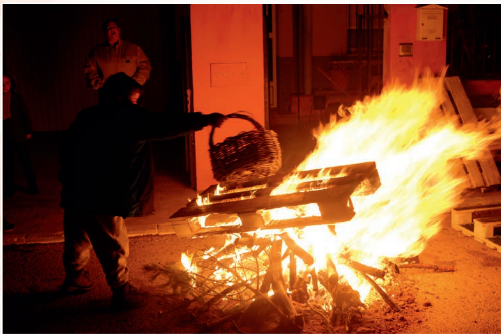
Uno de los Julianes de la calle Camporrobles le pega a la hoguera de su santo (año 2019).

Tras la conquista de Cuenca por Alfonso VIII en 1177; en 1182, el papa Lucio III fundó el Obispado de Cuenca , dependiente del Arzobispado de Toledo, unificando las antiguas diócesis cristiano-visigóticas de Valeria y Ercávica delimitadas en la división eclesiástica del rey Wamba en el 676 d.C. El primer obispo fue Juan Yáñez y el segundo San Julián , de nombre Julián ben Tauro (hijo de Tauro), que gobernó la diócesis, de la que es el patrón actual, desde 1198 hasta su óbito en 1208 . Los últimos estudios históricos asignan a San Julián su procedencia de una familia mozárabe de Toledo, es decir, de una familia cristiana que siguió practicando su religión en el área conquistada por los musulmanes. Su origen