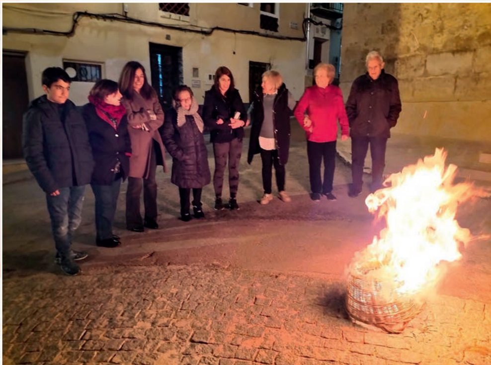
Los vecinos de la plaza de la Iglesia han mantenido viva la tradición de quemar una cesta la noche de San Julián (año 2024).

En Venta del Moro , la tradición la han mantenido con un hálito de vida los vecinos de la plaza de la Iglesia que, en la anochecida del 27 de enero, víspera de San Julián, se reúnen y queman una cesta vieja. Además, de unos años a esta parte se ha unido en el festejo la animada calle de Camporrobles, en la parte alta de la población, junto a la piscina. La coincidencia de varias personas llamadas «Julián» en la calle y las ganas de mantener esta tradición hacen que ese día, tarde-noche del 27 de enero, se reúna el vecindario de la calle y algunos amigos y se haga una pira con todas las cestas viejas recogidas durante el año sobre una base de leña variada (cepas fundamentalmente). Al calor de la pira, cuando el sol ya se ha ido y el frío avanza en la noche, se va cumpliendo con los encurtidos, fiambres y vino y ya, con las ascuas, se asa el rico embutido local y carne. En un acontecimiento de reunión vecinal y tertulia prolongada en la