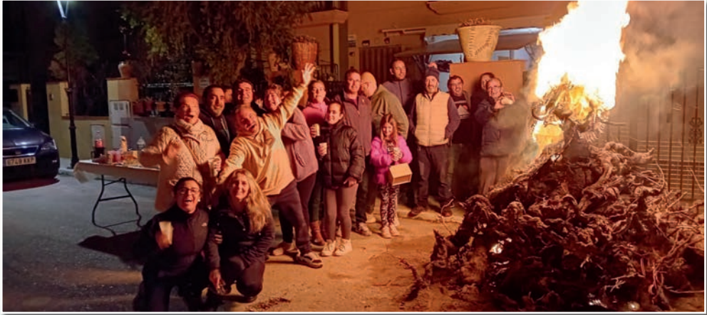
En la calle Camporrobles la noche del 27 de enero se celebra una concurrida y animada hoguera con condomio (año 2024).

de enero , día de la festividad del santo. Según los obituarios del obispado de Cuenca, la muerte de San Julián ocurrió el 20 de enero de 1208, pero su fiesta se fijó el 28 del mismo mes, probablemente por conveniencias litúrgico-pastorales.