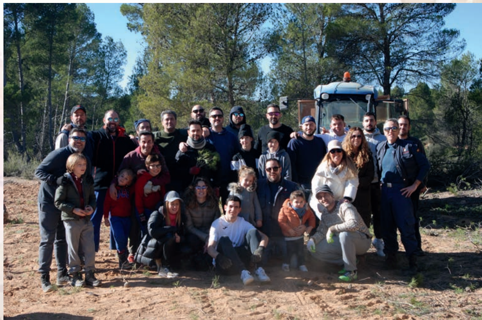
En las hogueras de San Antón es muy importante la participación de los jóvenes. Confeccionadores de la hoguera en Casas de Pradas en 2023.

Quienes confeccionan la hoguera, que son entre veinte-veinticinco personas, con predominio de jóvenes, quedan entre las nueve y diez de la mañana para salir a cortar pinos para la hoguera. La comisión que organiza las fiestas les facilita el almuerzo comunal (generalmente bollos) y la bebida que bien ingieren en la misma aldea o ya en el monte. Se dirigen con unos tres o cuatro tractores al monte, en el área señalada por el forestal o a la parcela de un particular si ha donado los pinos.