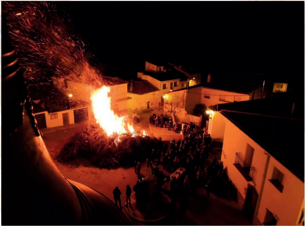
En Casas de Moya se confecciona una hoguera comunal y patronal de grandes dimensiones que congrega a todos los hijos de la aldea (año 2016).

de semana). Independientemente de la meteorología del día (lluvia, nieve), el ritual se lleva a cabo.