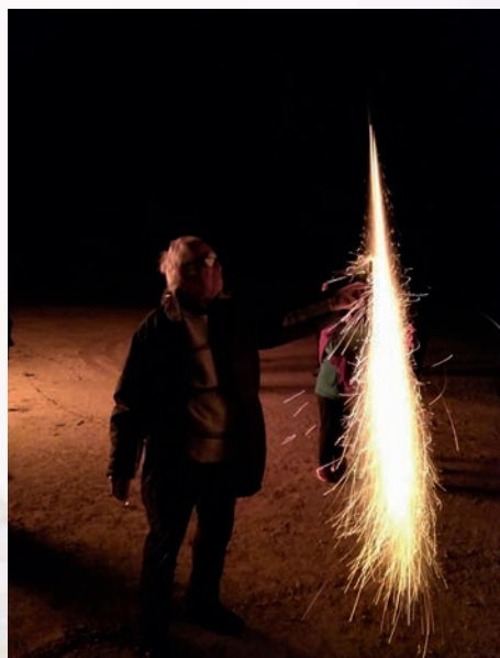
San Antón es una fiesta muy ligada a la pólvora. Casas del Rey año 2018.

En Venta del Moro pueblo, la gran hoguera comunal es la que se dedica a la Virgen de Loreto el 9 de diciembre (bien de relevancia local inmaterial desde 2022). En el caso de las hogueras de San Antón no hay hoguera comunal como ocurre en sus pedanías, sino que las piras se confeccionan por barrios y calles en reuniones de