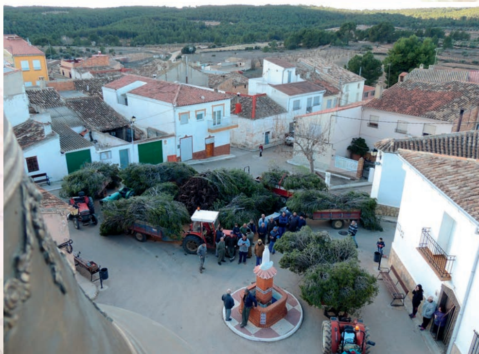
Preparación de la gran hoguera comunal y patronal de San Antón en Casas de Moya (2016, Paco Monteagudo).

Estas hogueras invernales se realizan cuando el campo reposa y las tareas agrícolas menguan en su urgencia. La dureza del frío invernal es contrarrestada con el calor de las llamas en una hoguera comunitaria que reúne a la vecindad para celebrar el santo y/o patronazgo, tras la recolección de las cosechas tradicionales (uva, almendra y oliva).