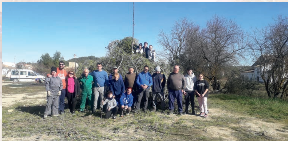
Hoguera de San Antón de Casas del Rey 2023.