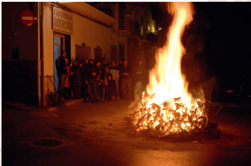
Las hogueras en Venta del Moro pueblo se realizan por calles y grupos de vecinos, familiares y amigos.

San Antonio también es un santo muy vinculado con el fuego . Su supuesta habilidad para reconocer y dominar a los espíritus o demonios, le atribuye un señorío especial sobre el mundo infernal y, en particular, sobre el fuego. Fue considerado