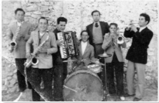
Las aldeas también celebraban sus bailes de acordeón y orquestinas. 1948, orquesta de Jaraguas.

Aparecerán en los programas de fiesta nuevas orquestas que tocaban en el salón de la Cámara Agraria como Piedras Azules (1979), Mapal (1981), Los Soniks (1981), los célebres Diamond (1982) con músicos de la comarca y el propio municipio, Los Centauros (1982), Ita Amarillo and Plátano (1983), Galaxia (1984), Los Cúper (también de la comarca) (1985) o Frontera (1985), entre otras. Esta orquestas se combinaban por primera vez con artistas conocidos como el revolu-