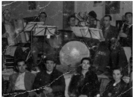
Orquesta venturreña amenizando el baile.

La zarzuela desapareció de las fiestas patronales, pero seguían los bailes populares en los salones de la población, con la inclusión en 1949 del gran baile del mantón de Manila. En 1956 se programó una novedad en las fiestas que hizo furor en años posteriores: los espectáculos de variedades, varietés o variedades arrevisadas como se denominaban. En 1958 hubo hasta tres sesiones de selectísimas variedades.