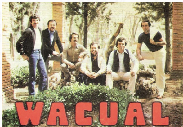
Los Wacual han amenizado muchos de los bailes de la comarca de 1966 a 2004.

todos los públicos como La Royal, Elipse, Malvarrosa, Evasión, La Crème (sucesores de los Wacual), Quinto Elemento, Divina Comedia, Nuevo Talismán, los poperos Jam, Vulcano Show, Ideal, Valparaíso y otras que ya han tocado en la Casa de la Cultura desde 1998.