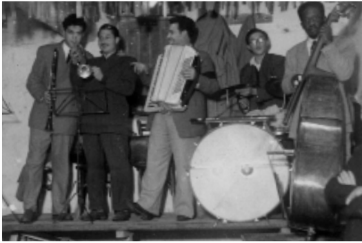
1950s. Baile de orquesta en el Café Collado.