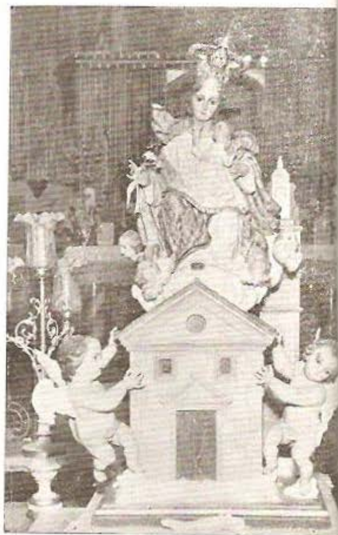
Ntra. Sra. de Loreto PATRONA DE VENTA DEL MORO

A ti Virgen soberana, Reina de mi corazón en esta tranquila mañana quiero hablaros a Vos. Soy Venturreña de raza, lo llevo en mi corazón y siento dentro de mi alma tus fiestas, que las de mi pueblo son. Se celebran en Diciembre, mes al que adoro yo porque estás Tú entre nosotros dándonos alegría y unión. A ti Virgen Loretana te abro mi corazón, sepas que te sigo amando con alegría y amor. La distancia nada influye y siento dentro de mi alma tu sagrada protección. A ti Reina soberana Patrona por elección soy Venturreña de raza y te llevo en mi corazón.