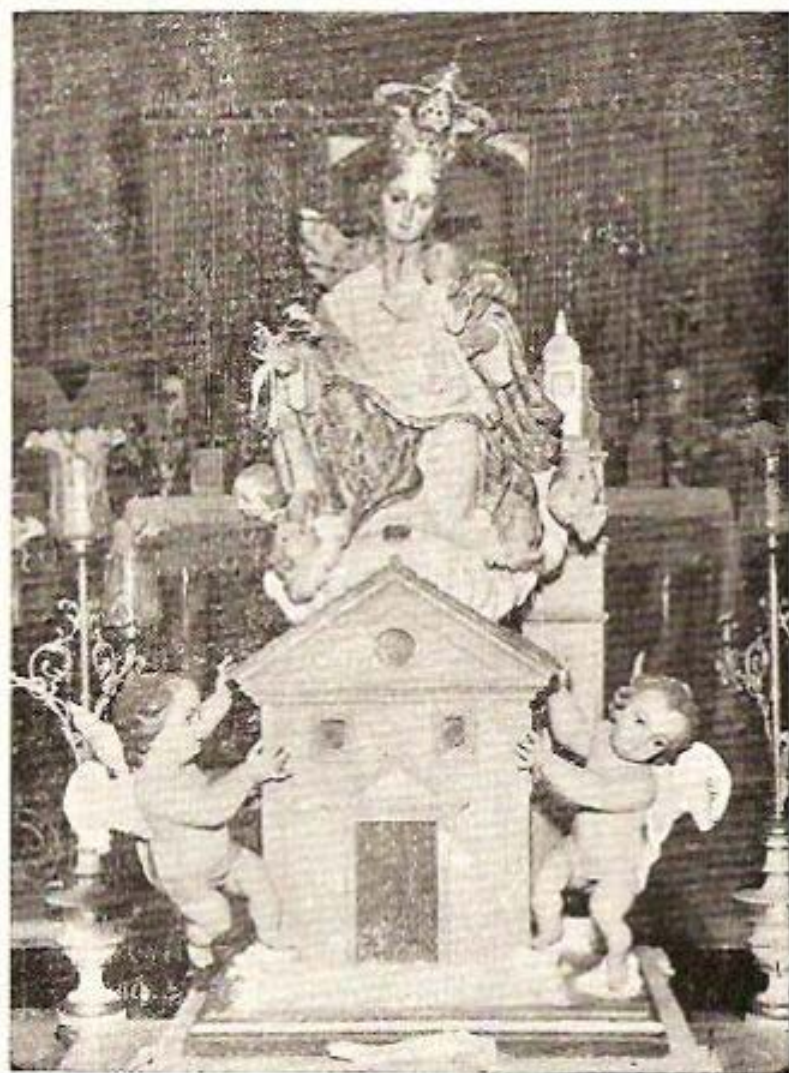
Virgen de Loreto PATRONA DE VENTA DEL MORO