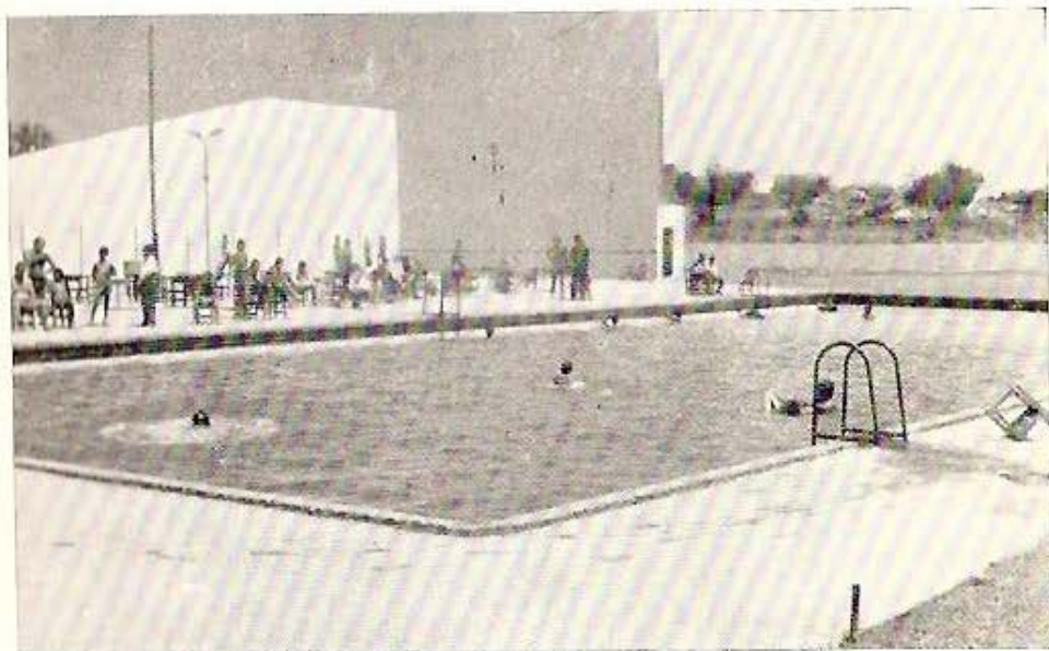
Panorámica de nuestra PISCINA