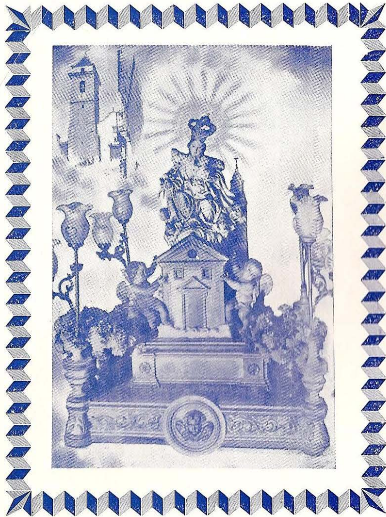
Venerada Imagen de Nuestra Señora de Loreto