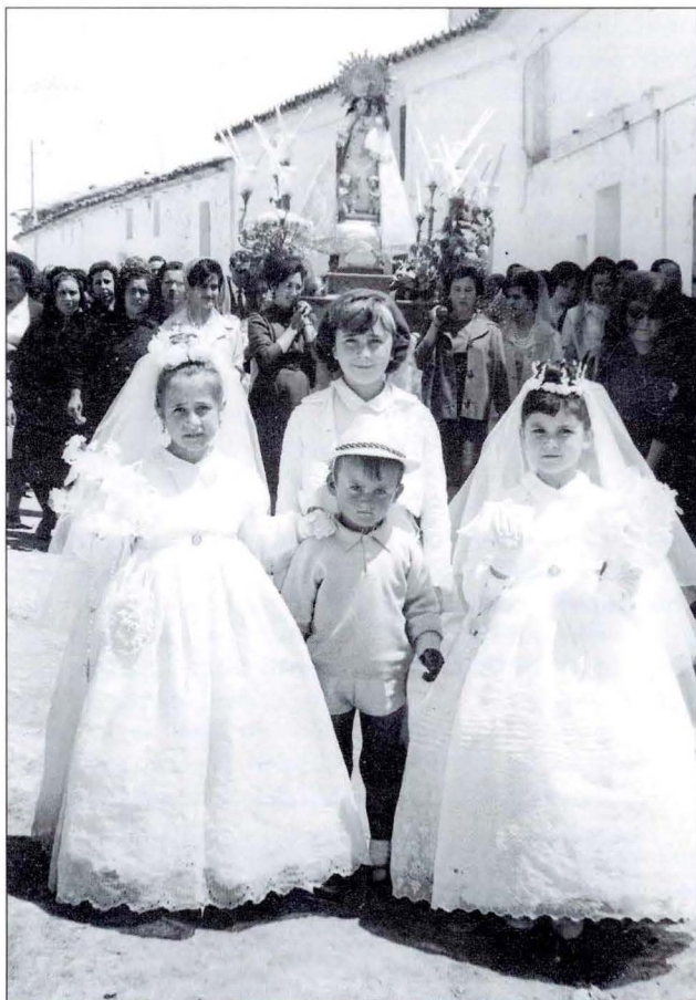
Comunión y procesión de la Virgen de los Desamparados (1962).

el recuerdo familiar a los difuntos y ya dentro del adviento, preludio de la Navidad, la fiesta patronal antigua de Jaraguas el día 3 de diciembre festividad de San Francisco Javier. En el manuscrito del arcipreste de Requena D. Pedro Domínguez de la Coba (1674-1737) que lleva el título de "Antigüedad y cosas memorables de la villa de Requena, escritas y corregidas por un vezino apasionado y amante de ella", leemos al referirse a la primitiva ermita de Jaraguas: