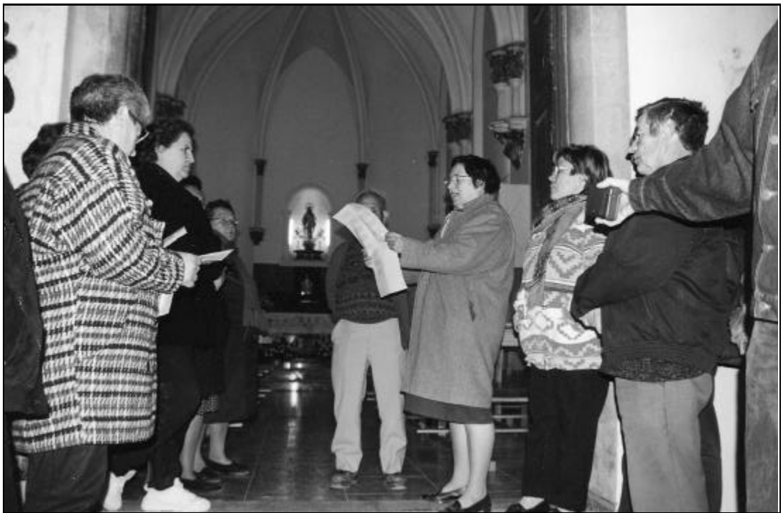
30 de abril del año 2.000. Los casarreños se reúnen a la puerta de la iglesia para cantar el mayo a la Virgen de las Mercedes. Seguidamente se entonan coplas espontáneas y alusivas a hechos acaecidos durante el año.

A vuestro amparo acudió arriesgada la pureza y de un vale a la certeza