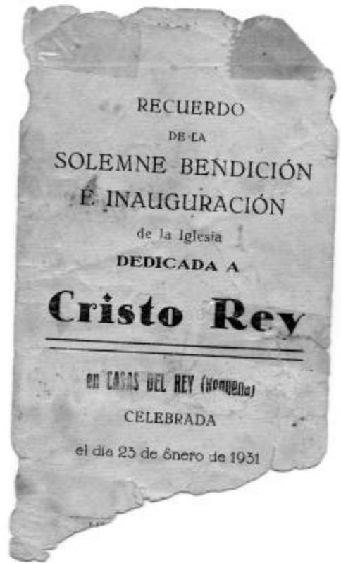
Recuerdo de la bendición e inauguración de la iglesia de Casas del Rey. 23 de enero de 1931.

tados del romance y el coro repite o retorna esos versos o la parte última de ellos. Con alternancia de solista y coro se va repasando el texto completo por medio de fragmentaciones sucesivas. El particularismo de nuestros aguilandos binarios apoyados en romances es que suelen añadir una o dos estrofas petitorias al final, las cuales suelen tener versos de menor número de sílabas que el propio roman-