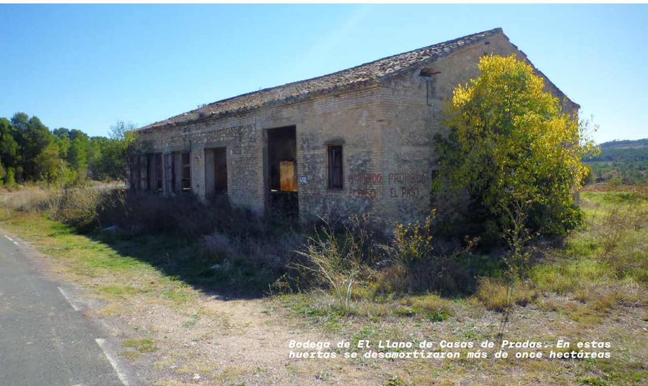
Bodega de El Llano de Casas de Pradas. En estas huertas se desamortizaron más de once hectáreas

Otras propiedades que no se enumeran en el Catastro y que serían enajenadas en la última desamortización (1855), eran las que perte-