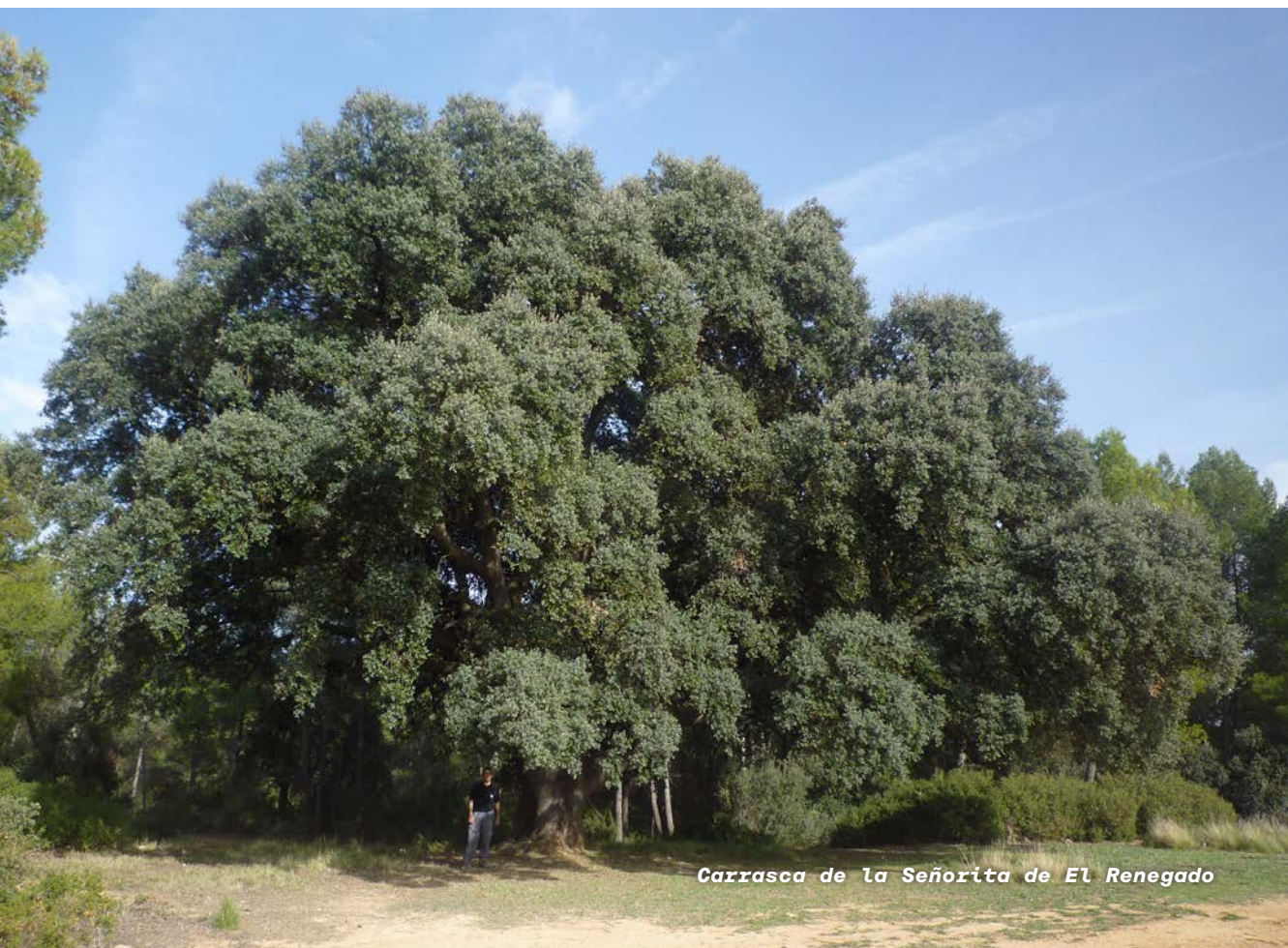
Carrasca de la Señorita de El Renegado

El Nomenclátor de la provincia de Valencia del Instituto Geográfico, Catastral y de Estadística de 1930 y 1940 nombran las Casas del Renegado como un caserío del término venturreño con seis edificios y 13 y 26 habitantes respectivamente, sin que en Caudete de las Fuentes señalen estas fuentes un topónimo igual o similar. Todos los padrones del siglo XX y XXI censan a los ha-