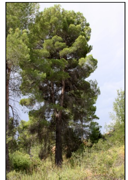
Pino nº 7