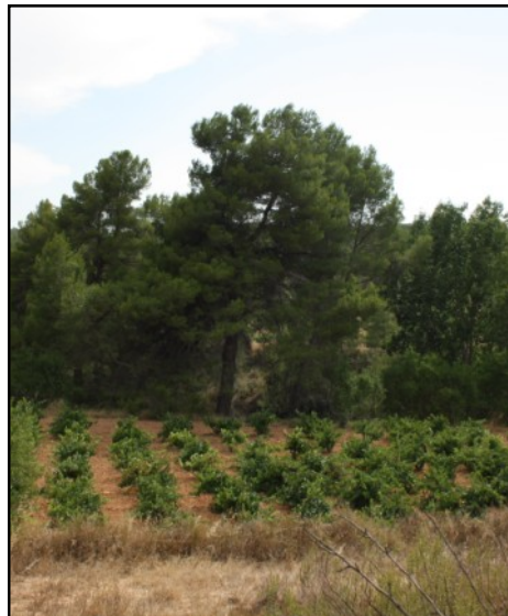
Pino nº 5. Viga del Puente de la Bullana