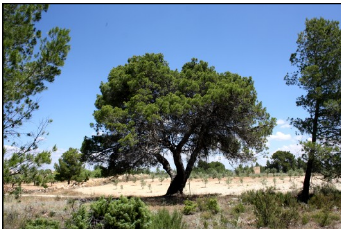
Pino del Tío Isidoro