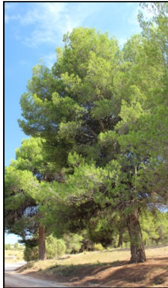
Pino nº 2