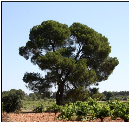
Pino nº 1