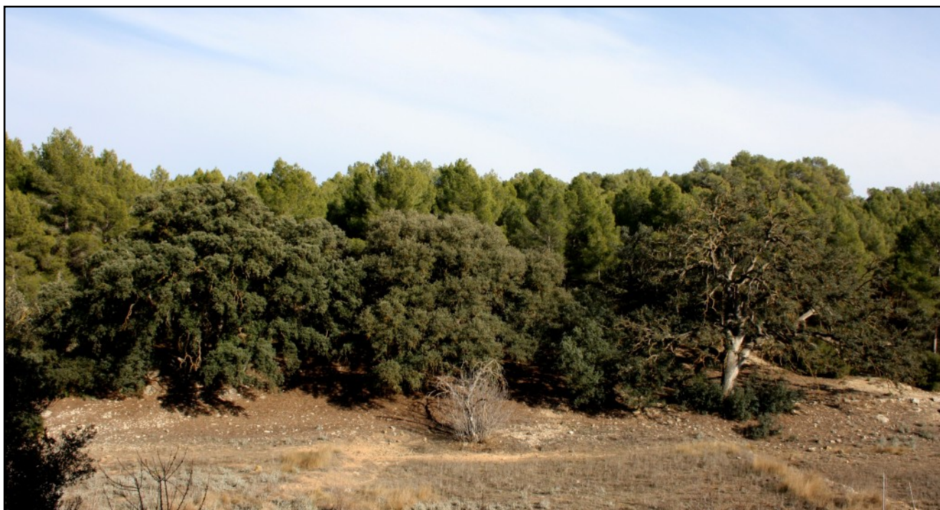
Carrascas nº 1, 2 y 3