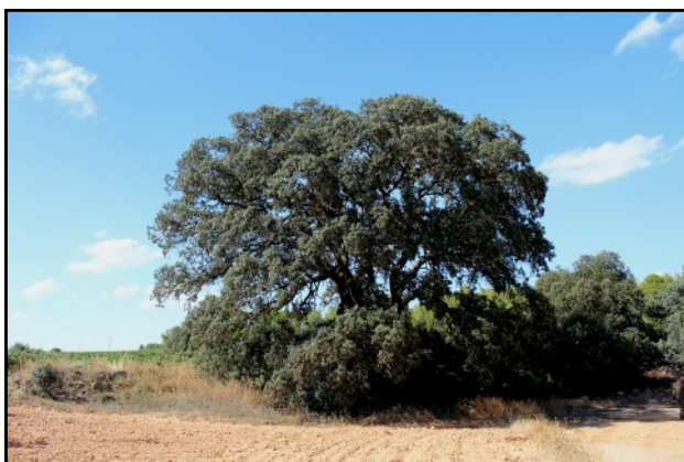
Carrasca nº 1