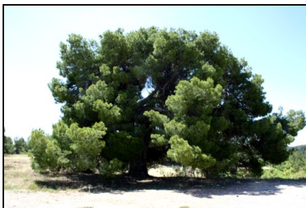
Pino de la Tía Dolores