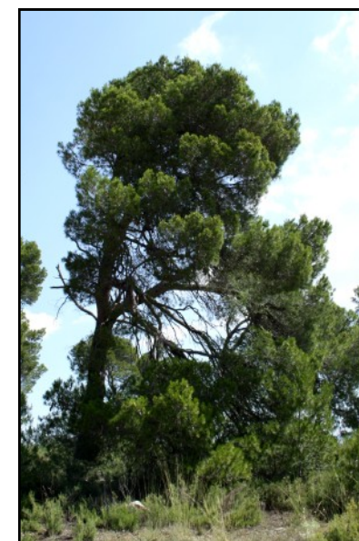
Pino nº 6