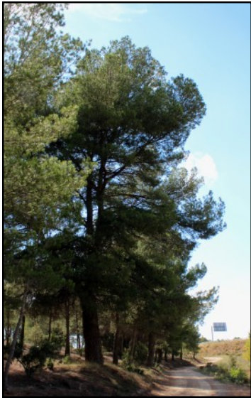
Pino nº 1