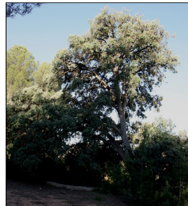
Carrasca nº 4