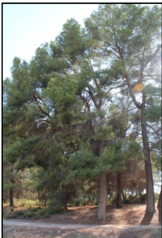
Pino nº 7