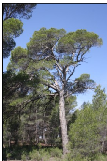
Pino nº 3