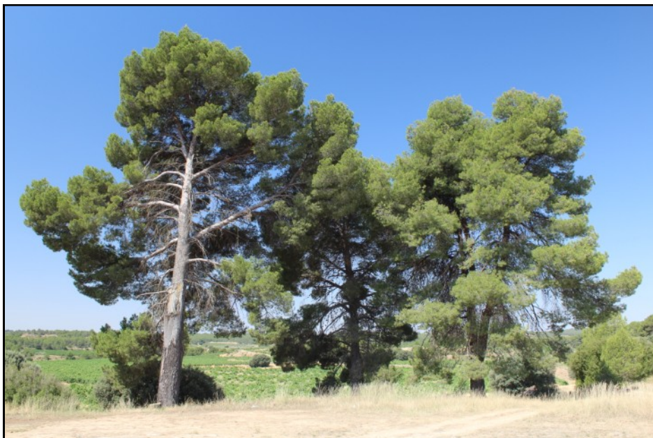
Pinos nº 1, 2 y 3