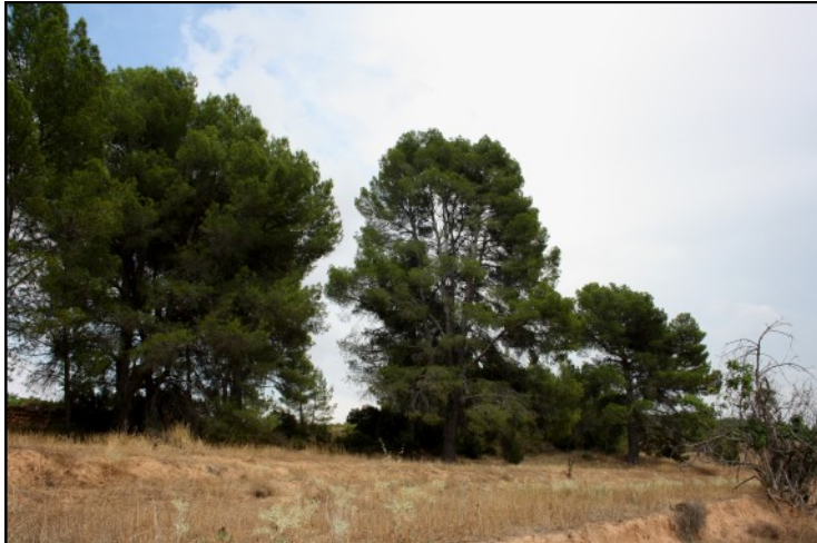
Pinos nº 1, 2 y 3