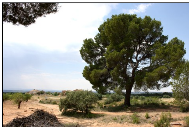
Pino nº 2