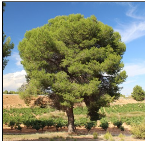
Pino nº 3