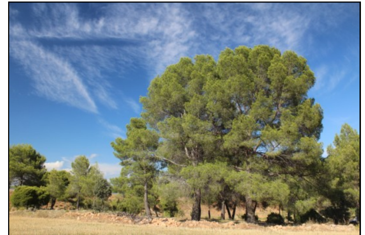
Pinos nº 8 y 9