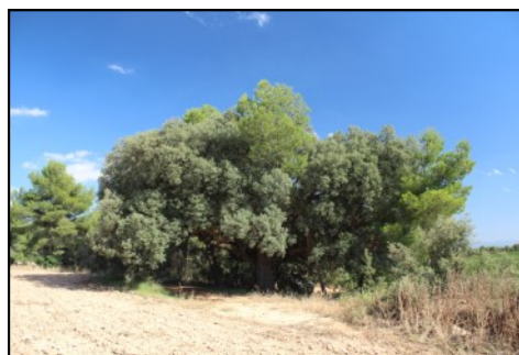
Carrasca nº 3