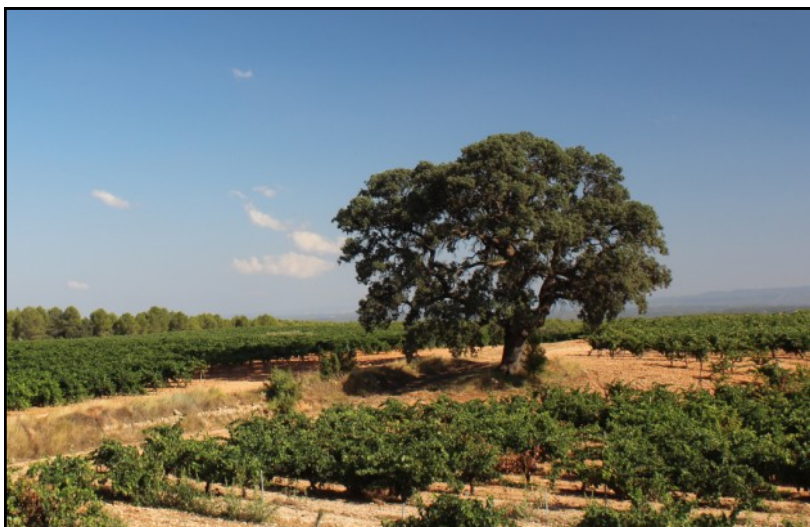
Carrasca nº 6