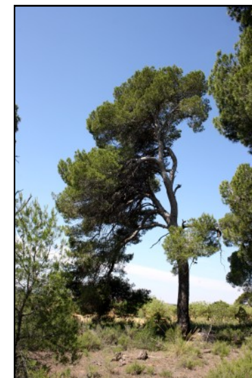
Pino nº 5