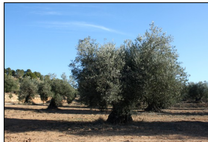
Olivo nº 3 y olivar