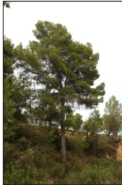
Pino nº 6