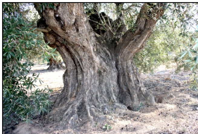
Tronco olivo nº 4