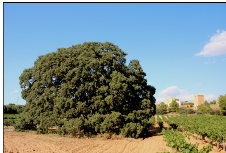
Carrasca nº 4