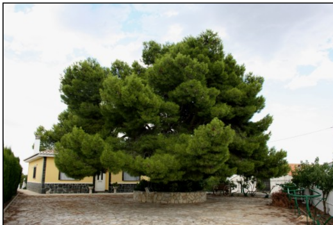
Pino de Gori