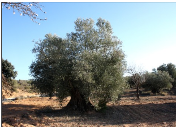
Olivo nº 1