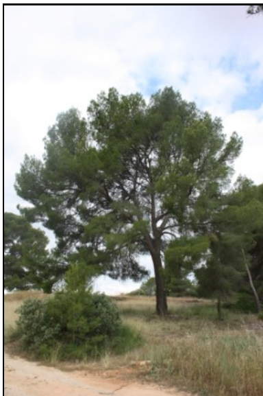
Pino nº 5