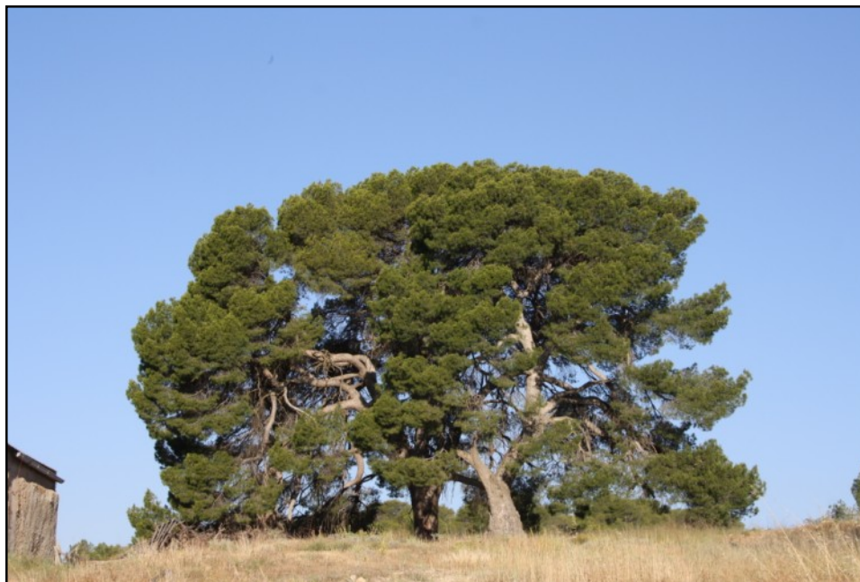
Pinos nº 1, y 2