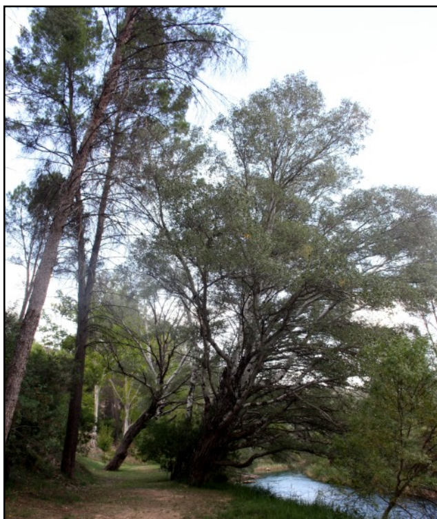
Chopo nº 5