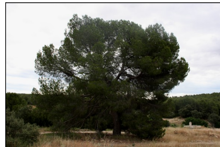
Pino nº 6