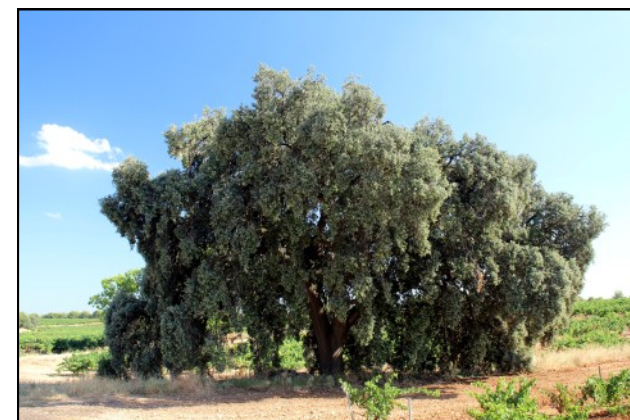
Carrasca nº 5