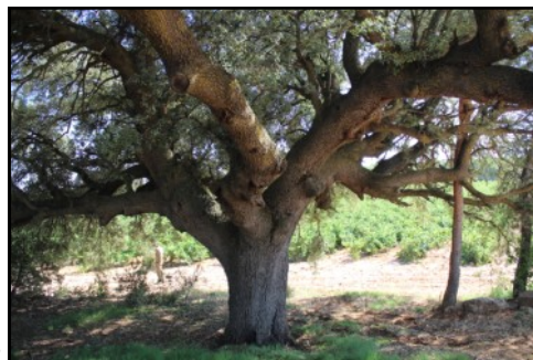
Carrasca nº 2