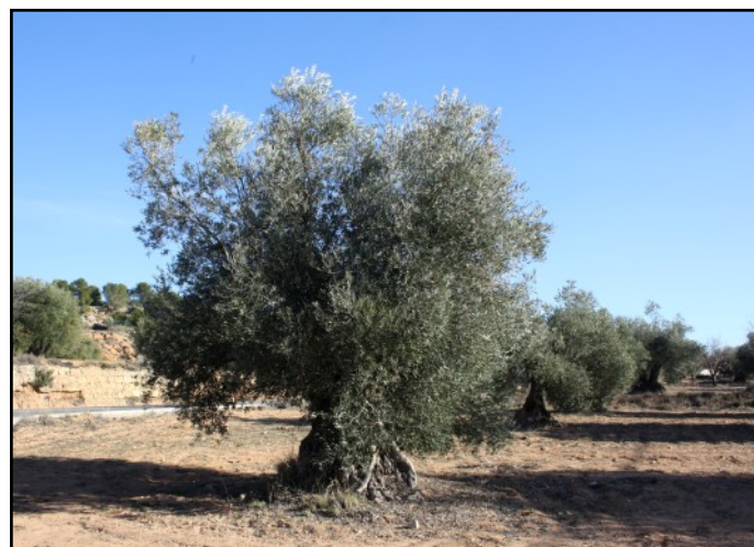
Olivo nº 5