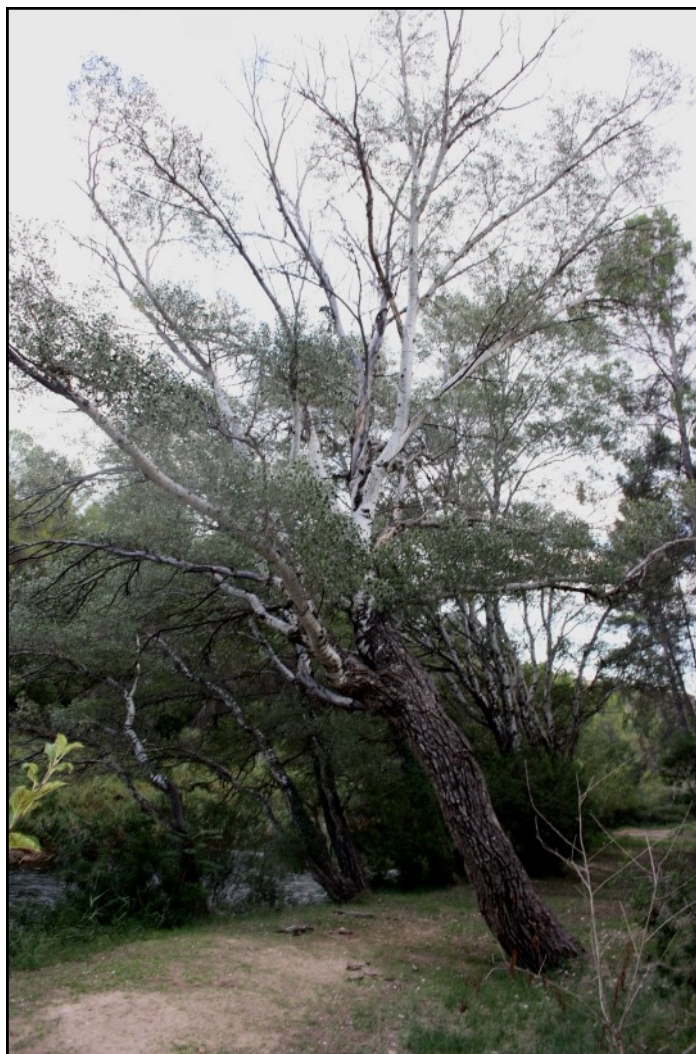
Chopos nº 1 y 5