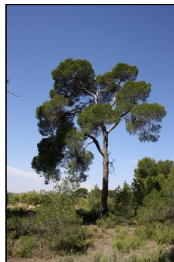
Pino nº 4