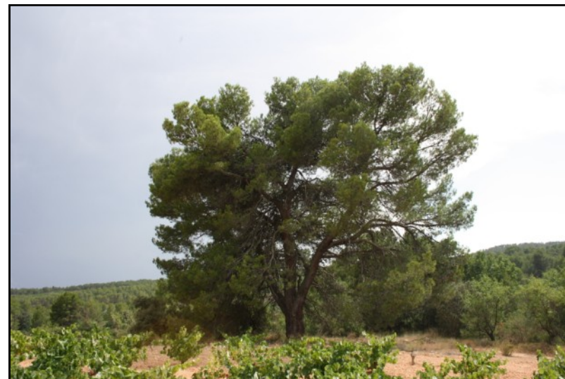
Pino nº 4