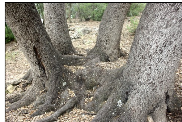
Carrasca nº 3 (Carrasca de los 4 pies) Detalle de la base.