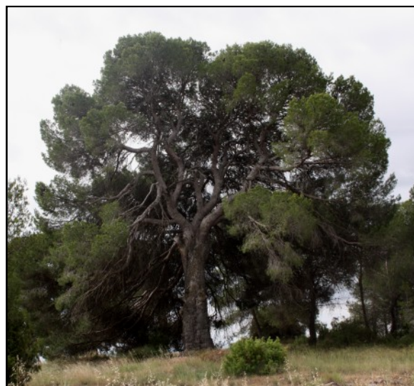
Pino nº 3