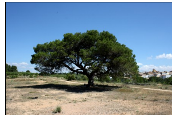
Pino de la Era