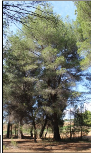
Pino nº 5