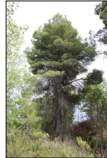
Pino nº 8