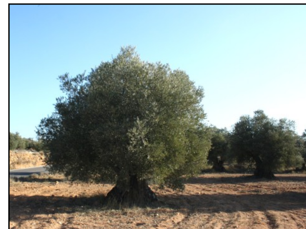
Olivo nº 2