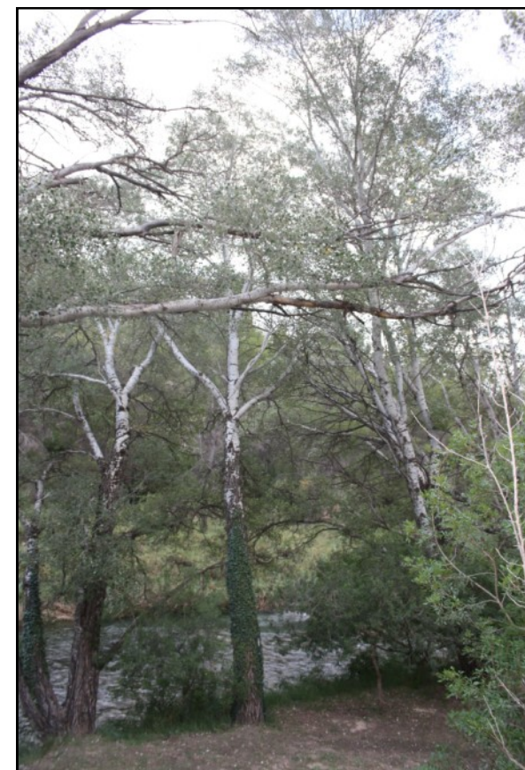
Chopos nº 2, 3 y 4