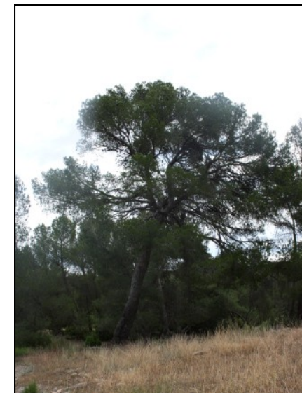
Pino nº 4