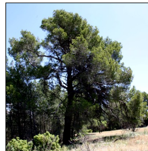
Pino de los Haya