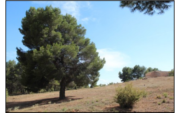
Pino nº 4